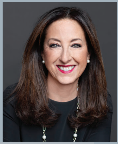
Mise en beauté : Véronique Prud'homme